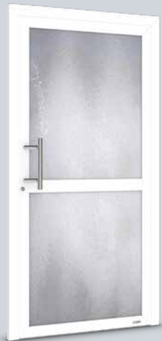
Modell Solo 2