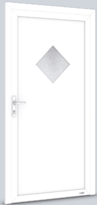
Modell Solo 10