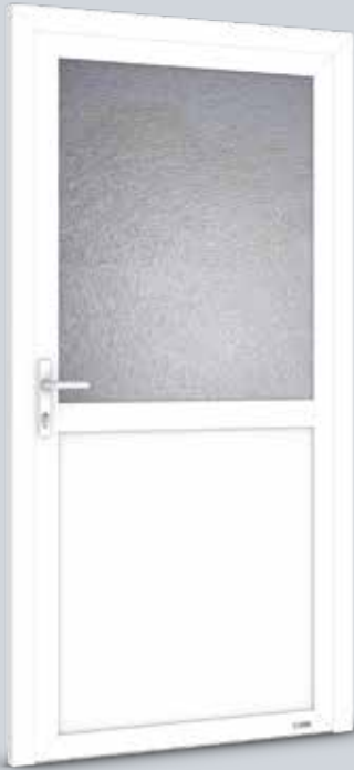
Modell Solo 2.1