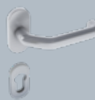
abgekröpfter Drücker auf Oval-Rosette, Edelstahl