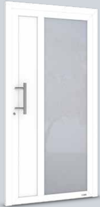
Modell Solo 4