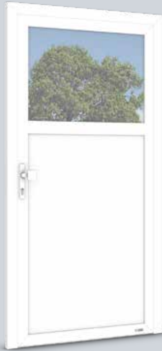
Modell Solo 3