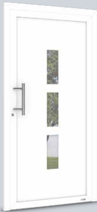
Modell Solo 9