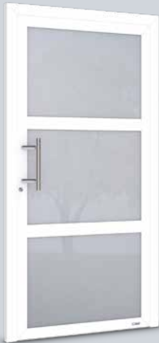
Modell Solo 6