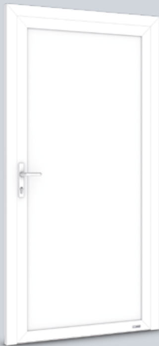
Modell Solo 1.1