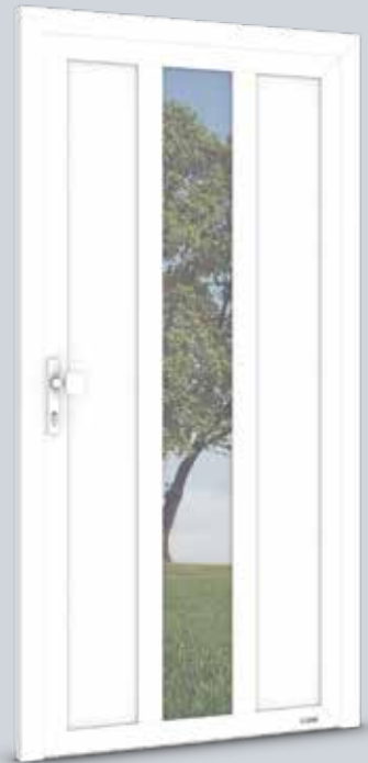
Modell Solo 7