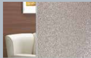
Ornament 504 weiß