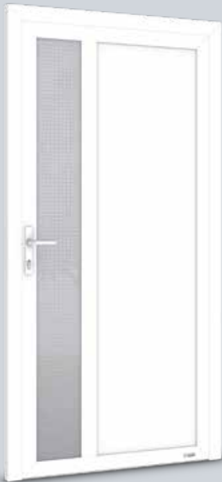
Modell Solo 5