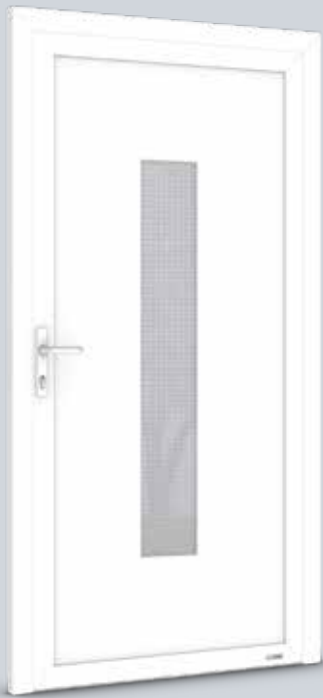
Modell Solo 8